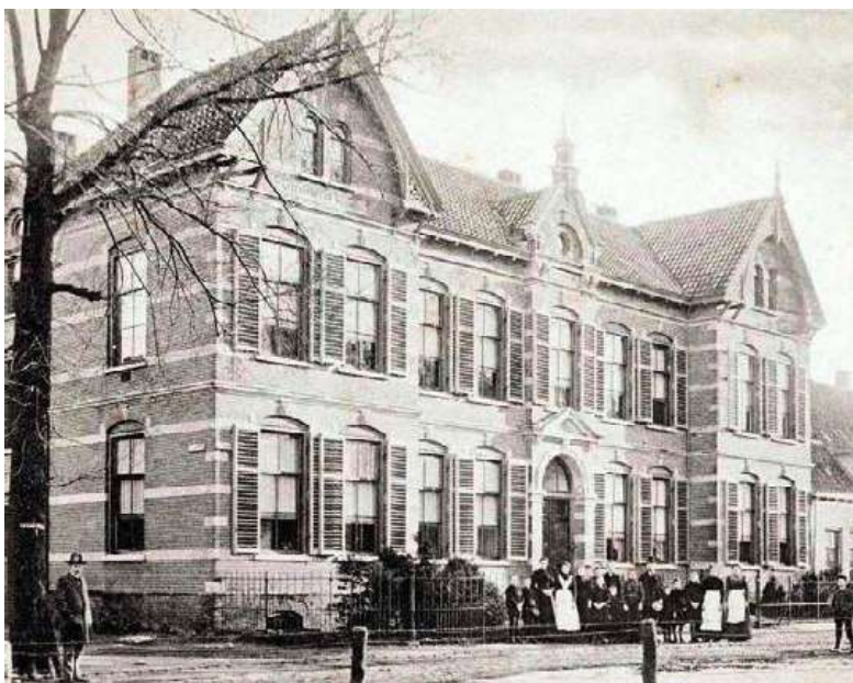
Het Gereformeerd Weeshuis, dit stond Hogeweg 4 in Amersfoort.